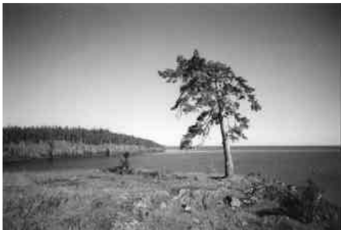
Скалистый берег.

Так образуется своеобразная ось (как спица колеса), вертикальная энергетическая структура, где пространство и время находятся в своих экстремальных состояниях. Действительно, давно замечено на Валааме множество чудес, в том числе и факты отставания часов 4 .