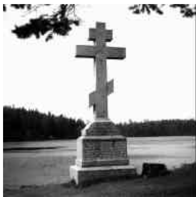
Поклонный крест на берегу Малой Никоновской бухты.

История повествует о развитии и росте Валаамской обители — древнейшем на Руси монастыре, ставшем верным оплотом христианской веры и культуры. Как к живительному источнику стекались сюда ищущие праведной жизни и духовного общения. Принимали здесь крещение, становились монахами, получали благословение открывать новые обители.