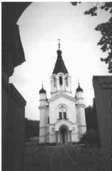
Всехсвятский скит. (Ф. Е. В. Фалева)

ти столь сильное напряжение всех сил — человеческих, физических, и духовных.